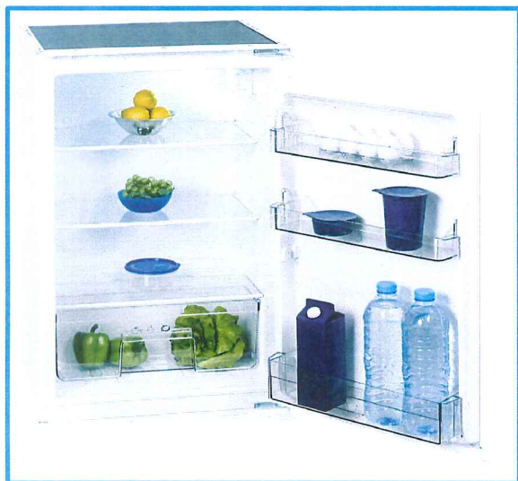
EKS 131-4.2 RVA+