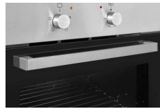
Griff Ergonomischer Griff