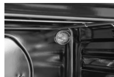
Beleuchtung Helle Beleuchtung des Innenraums