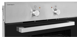
Bedienblende ohne Uhr Übersichtliche Bedienelemente