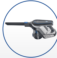
Mit einem Klick vom Bodestaubsauger zum Handstaubsauger