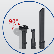
Inkl. 3 zusätzlicher Düsen